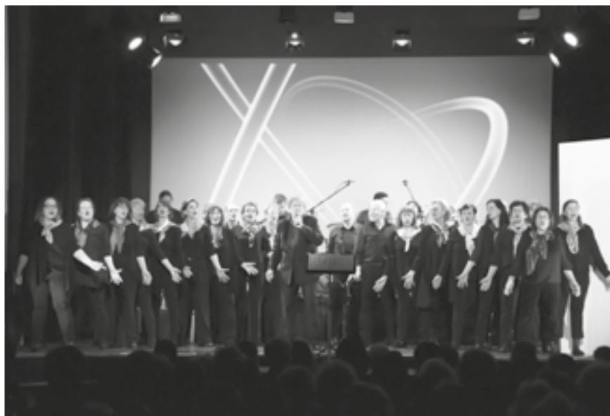
Spectacle du 25 ème à la Grande Salle du Mont-sur-Lausanne, les 23 et 24 mars 2019

Propos recueillis par l'équipe du centre socioculturel