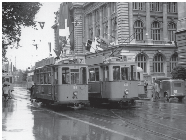
A St. François

discours. Des pourparlers entre communes avaient même eu lieu pour savoir quel syndic prononcerait l'allocution d'adieu au tram, celui de Pully, de Lausanne ou celui de Renens.