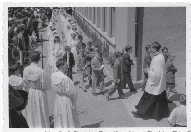
Inauguration de l'église

Au début du 20 e siècle, Lausanne s'étend vers l'Ouest. Le châtelain William de Charrière de Sévery possède un vaste domaine qui s'étend alors de la route de Prilly jusqu'au ruisseau du Galicien. En 1932, il décide de se séparer de certaines de ses terres.