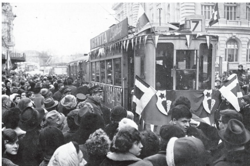
La fin du tram 7

sonnalités politiques municipales, cantonales, fédérales, ainsi que la Fanfare des Tramways, ont voulu immortaliser ce moment par leur présence festive, musicale et leurs