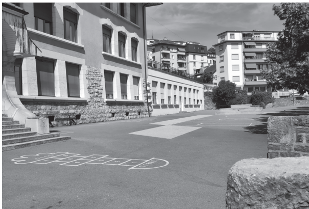
Le préau actuel de Prélaz

«Les écoles occupent une place très importante dans la vie des enfants, et cela suffit à justifier que l'on cherche à connaître leur point de vue sur les lieux où ils travaillent, jouent, bavardent, mangent, se reposent ou rêvent.»*