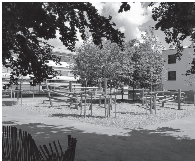
Le nouveau préau du Vieux-Moulin